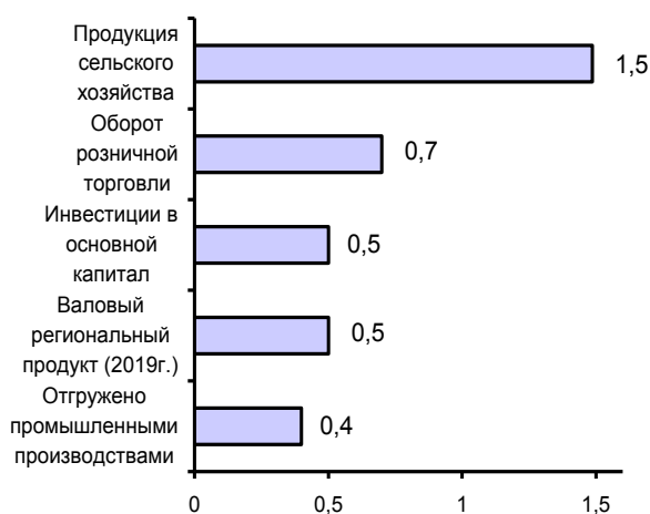
УДЕЛЬНЫЙ ВЕС ОБЛАСТИ В ОБЩЕРОССИЙСКИХ ОСНОВНЫХ ЭКОНОМИЧЕСКИХ ПОКАЗАТЕЛЯХ в 2020г.